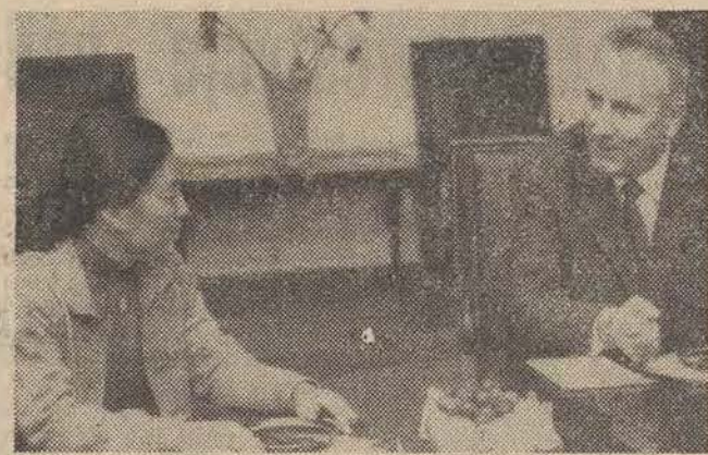
8 bm. I sekretarz KC PZPR Edward Gierek i prezes Rady Ministrów Piotr Jaroszewicz przyjęli przybywającą w Polsce minister spraw zagranicznych Tymczasowego Rządu Rewolucyjnego Republiki Wietnamu Południowego Nguyen Thi Binh.