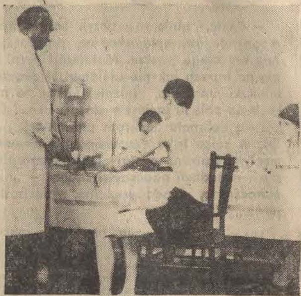
Jesteśmy w budynku przy ul. Szpitalnej 3/5. Przez kilkadziesiąt lat służył on jako szkoła, teraz jest siedzibą Dzielnicowej Komisji Poborowej Łódź — Widzew. Wchodząc czujemy jeszcze zapach świeżej farby. Wszystkie pomieszczenia pomalowano na jasno, pastelowe kolory, wyposażono w niezbędne urządzenia.

W świetlicy kilkudziesięciu młodych ludzi czeka na badania lekarskie. Na ścianach pląszące informujące o szkołach lekarskich oraz gazetki fotograficzne. Na stołkach wydawnictwa lekarskie i MON. Dwa razy dziennie wygłaszane są prelekcje na tematy obronności kraju, polityki naszego państwa, chorób społecznych. Onorowo też prowadzony przez PSS Widzew dobrze zaopatrzony bufet.