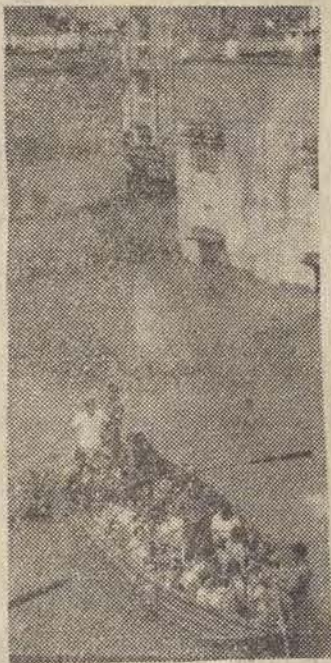
N/z: Ewakuacja ludności z zalanych wód domów. CAF — UPI — telefoni

Ponad 20 milionów ludzi zostało dotkniętych skutkami niezwykle groźnej powodzi, nekającej stan Uttar Pradesh, w północnej części Indii. Zginęło tam ponad pół miliona ludzi.