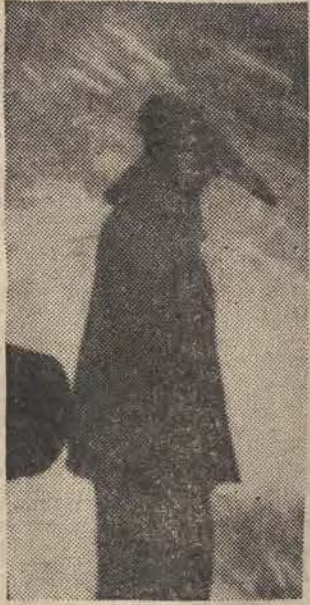
Dla uczczenia VI Zjazdu partii załoga Huty im. Lenina podjęła zobowiązania dodatkowej produkcji. Na zdjęciu: wytop surówki w Hucie im. Lenina.