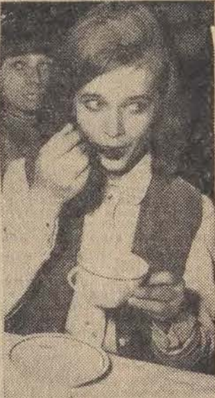
Wszystkie zupy „błyskawiczne” smakowały wczorajszym konsumentom.

Wszystko, co ułatwia szybkie ugotowanie dobrego obiadu, kobieta pracująca wita z zadowoleniem. Toteż wiele gotowych zup w proszku, czy w kostkach zdobyło się rynek. Coraz większym powodzeniem cieszą się np. zupy błyskawiczne, m. in. z zielonego groszku, biały i czerwony barszcz, krupnik na mięsie. Ale która z gospodyni wie na przykład, że nasz przemysł koncentratów spożywczych w sumie produkuje ponad 30 różnych zup? A oprócz tego jeszcze około 350 rodzajów innych koncentratów, jak ekstrakt, przyprawy, aromaty, desery itp.