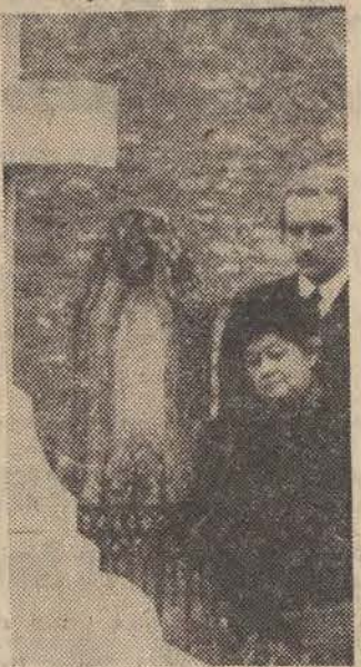
Na zdjęciu: żona i syn przy grobie zmarłego generała de Gaulle'a

We Francji odbywają się uroczystości związane z pierwszą rocznicą śmierci generała de Gaulle'a. W katedrze Notre Dame w Paryżu odbyło się nabożeństwo, na którym obecny był prezydent Francji G. Pompidou, członkowie rządu francuskiego oraz dyplomaci akredytowani w stolicy Francji.