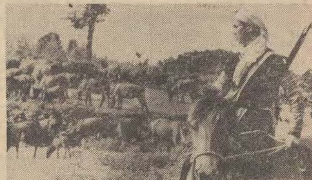
Uczniowie szkoły rolniczej w Hoa Sinh wiadomości teoretyczne zdobywane na lekcjach uzupełniają praktycznie zajmując się hodowlą bydła i uprawą roli. N/z: na szkolnym pastwisku.

Incident ten wydarzył się dokładnie w rok potem, kiedy 21-letni Ekkehard Weill postrelał żołnierza radzieckiego pełniącego wartę pod pomnikiem żołnierzy radzieckich w dzielnicy Berlina zachodniego — Tiergarten.