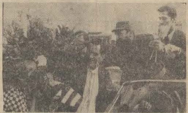
N/z: Fidel Castro otrzymuje kwiaty od jednej z mieszkanki Santiago.

Premier Kuby Fidel Castro, przebywający z wizytą oficjalną w Chile, przeprowadził w czwartek w Santiago w pałacu prezydenckim pierwsze rozmowy z prezydentem Chile, Salvadorem Allende. Tysiące mieszkańców stolicy zgromadziło się przed pałacem, aby powitać przed gmachem pałacu.