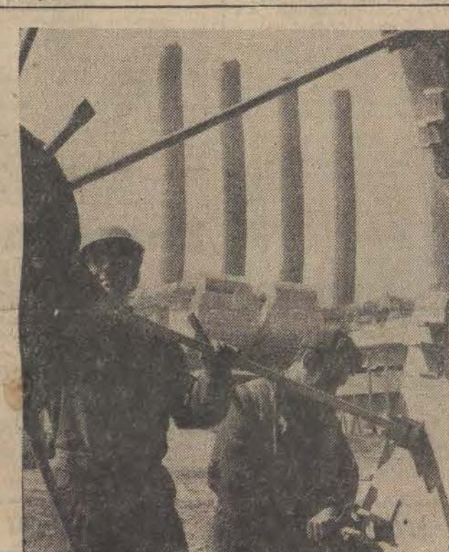
Zaloga Cementowni „Warta” w Działoszynie zameldowała, że 30 listopada br. wykonała podjęte przez siebie zobowiązanie wyprodukowania 10 tys. ton cementu dla uczczenia VI Zjazdu PZPR.

W toku rozmowy, która przebiegała w serdecznej, przyjacielskiej atmosferze, Edward Gierek wyraził uznanie dla wyników warszawskiej narady ministrów i podkreślił jej doniosłe znaczenie dla sprawy bezpieczeństwa i współpracy w Europie.