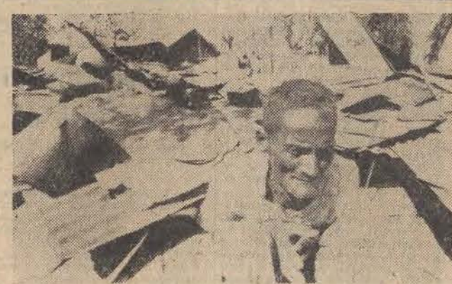
Wojska pakistańskie spacyfikowały wioskę w pobliżu Dakki. Mieszkańcy wioski podejrzani byli o udzielanie pomocy partyzantom bengalskim. N/z: jeden z niewielu ocalałych mieszkańców na ruinach domu.

3 grudnia br. o godzinie 14.55 Polskie Radio w programie II i w programach wszystkich różnojęzycznych wojewódzkich oraz Telewizja Polska o godzinie 14.50 w programie ogólnopolskim przeprowadzą bezpośrednią transmisję centralnej akademii z okazji Dnia Górnik.