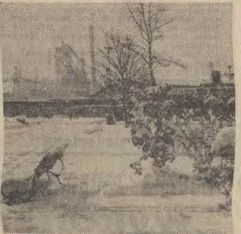
Zima przystroiła już w śnieżną szatę Ostrawę — stalowe „serce” Czechosłowacji.