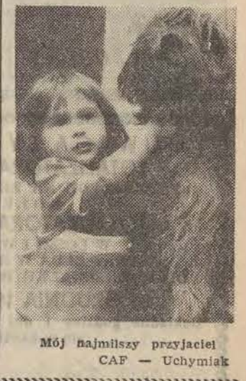
Mój najmilszy przyjaciel

Tym, co zadecydowało o sukcesie łódzkiego Teatru „77” jest prosta, komunikatywna poetyka przedstawienia „Kole czy tryptyk”. Święty pod wieloma względami „Sennik polski” Teatru STU, świetny aktorsko, świetny w zamysle inscenizacyjnym, klarowny myślowo, ma jednak kilka scen nieco efekciarskich. Teatr Osmego Dnia w „Jednym tchem” nadużywa symboliki, to natrętny, to znów tak wieloznacznej, że aż nie do rozszyfrowania. Ze spółki Teatru „77” udało się znaleźć najprostszą, a jednocześnie mocno angażującą widownie sposoby wypowiedzi. Zmusza też spektakl widza do zadawania sobie pytań — jaki jest mój udział w tym, co było, co jest i co będzie w naszym kraju. Zarysowuje postawę aktywną, przecina koło historii, otwiera możliwości myślenia od nowa. JERZY KATARASINSKI