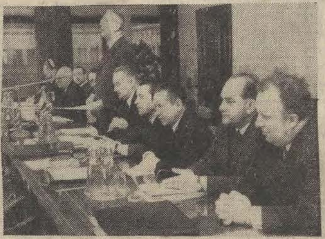
Na zdjęciu: przemawia E. Gierek. W prezydium (od prawej) St. Olszowski, J. Szydłak, E. Babuch, J. Tejchma, P. Jaroszewicz. W głębi widoczny H. Jabłoński i M. Jagielski.

Wczoraj obradowało II Plenum Komitetu Centralnego PZPR pod przewodnictwem EDWARDA GIERKA. Celem obrad było omówienie zadań instancji i organizacji partyjnych w realizacji wniosków wynikających z dyskusji przedzjazdowej i uchwał VI Zjazdu PZPR.