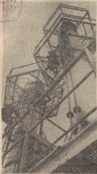
Instalacje gazowe najlepiej rozpoznano i zagospodarowano w okolicy Lubaczowa na terenie Polski południowej - wokół Lubaczowa.