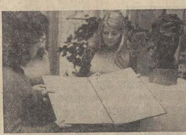
Setną rocznicę urodzin Andrzeja Struga (28.XI.1971 r.) uczelny Instytut Filologii Polskiej UW i Biblioteka Uniwersytecka zorganizowaniem w Warszawie wystawy pt. "Twórczość Andrzeja Struga".

Na zdjęciu: dyplom Nagrody Literackiej m. Łodzi, przyznanej Andrzejowi Strugowi w roku 1935.