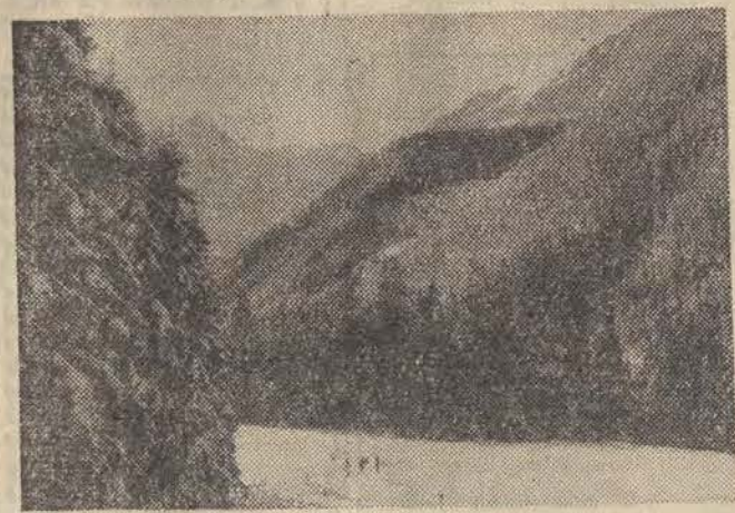
Na zdjęciu: idziemy na Halę Ornak. Prosimy z nami.