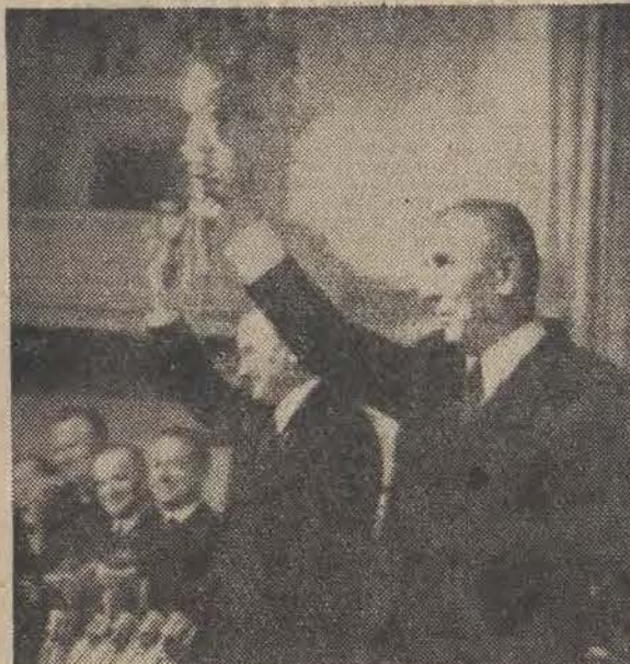
E. Gierek i P. Jaroszewicz dziękują za owoce z okazji wyboru ich do najwyższych władz partyjnych.

jął kardynała Stefana Wyszyńskiego. Przedmiotem rozmowy były problemy normalizacji stosunków między państwem i kościołem.