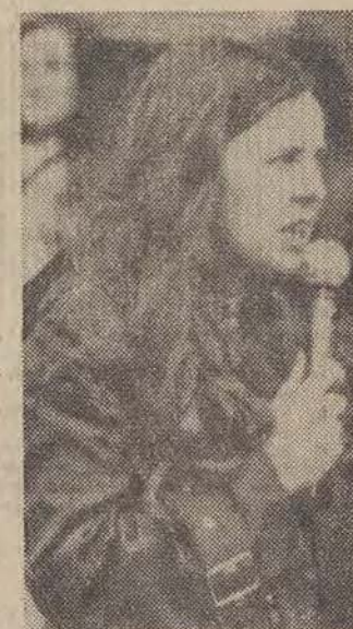
Na zdjęciu: Bernadette Devlin, posłanka do Izby Gmin z Ulsteru, bojownicza o prawa ludności północnoirlandzkiej.

Austriak, Kurt Waldheim został sekretarzem generalnym ONZ.