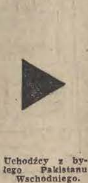
Uchodźcy z byłego Pakistanu Wschodniego.