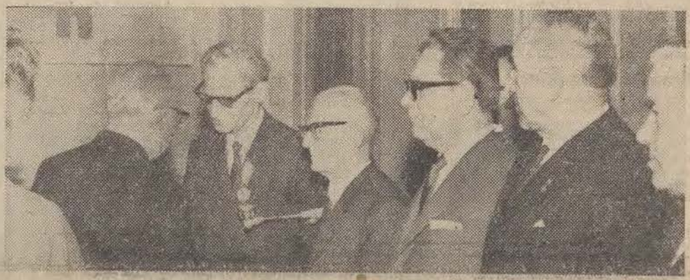
Członek Biura Politycznego KC PZPR — H. Jabłoński dekoruje działaczy PPR Orderem Sztandaru Pracy.