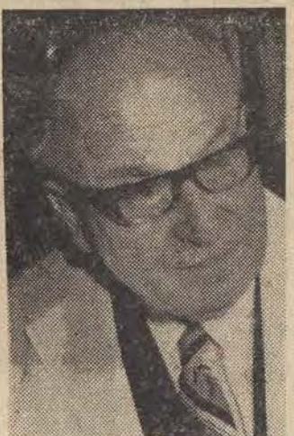
Głównego, a od 10 lat jest rektorem „Endokrynologii Polskiej”.