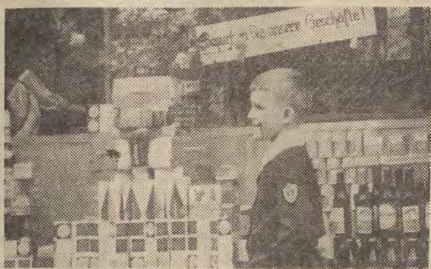
W trosce o złotówkę przywożone z Nysy zrobiono wszystko. Nawet w budce ze słodyczami spotkamy dwujęzyczne reklamy.