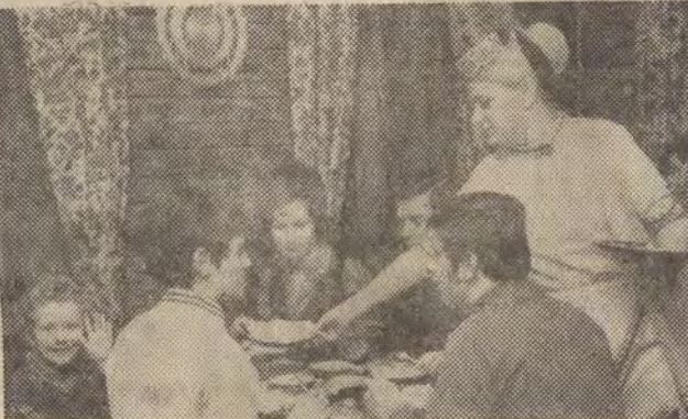
Prawdziwą karierę zrobiła zgorzelecka „Karczma Piastowska”. Niemal do zasad dobrego tonu należy wybrać się na kolację do Polski, a skoro w Polsce, to właśnie w „Karczmie”.