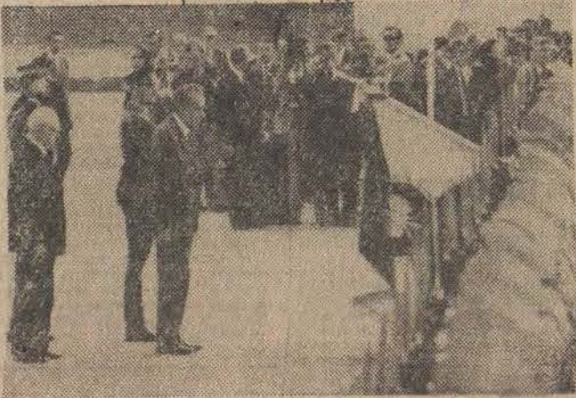
N/z: prezydent R. Nixon oddaje honory sztabarowi kompanii honorowej.

PODPISANIEM WSPÓLNEGO KOMUNIKATU POLSKO-AMERYKAŃSKIEGO — W WAŻNYCH SPRAWACH MIĘDZYNARODOWYCH I STOSUNKÓW DUWSTRONNYCH — ZAKOŃCZYŁ I BM. WIZYTĘ W POLSCE PREZYDENT STANÓW ZJEDNOCZONYCH RICHARD NIXON. W CIĄGU SWEGO POBYTU W NASZYM KRAJU PREZYDENT USA PRZEPROWADZIŁ ROZMOWY Z EDUARDEM GIEREKIEM, HENRYKIEM JABŁOŃSKIEM I PIOTREM JAROSZEWCZEM ORAZ ZWIEDZIŁ WARSZAWĘ.