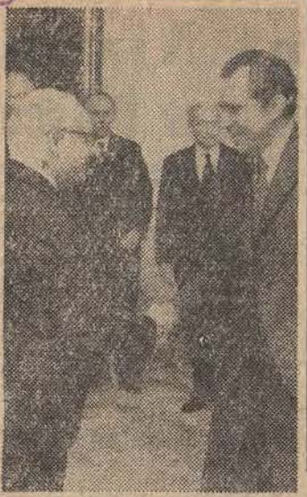
Na zdjęciu: Henryk Jabłoński wita Richarda Nixona w Belwedrze.