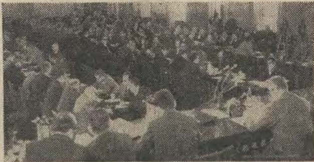
N/z: widok ogólny sali obrad.

Trzeci referat wygłosił członek Biura Politycznego, sekre-