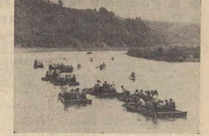
Nie tylko na szosach Północy obserwujemy wzmożony ruch. Również na Dunajcu zrobił się tłok: sypkują łodzie flisackie z turystami. Nie brak też prywatnych kajaków i kanadyjek. N/z: łodzie flisackie na Dunajcu.