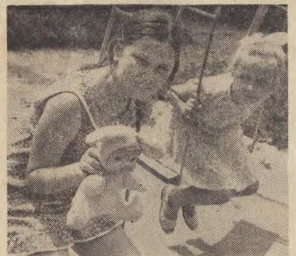
CAF — Matuszewski