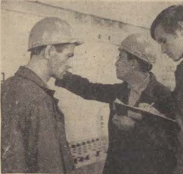
NA ZDJĘCIU: Przy pulpicie sterowniczym

Budowa kombinatu motoryzacyjnego w Bielsku-Białej nadal przebiega szybko i sprawnie. Hala nowej lakierni i montażu jest aktualnie w pełnym rozruchu technologicznym.