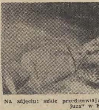
Na zdjęciu: szałki przedstawiające połączenie „Apolla” i „Sojuza” w Kosmosie.

Polączenie stateków zostanie dokonane mniej więcej po upływie doby od startu „Apolla” i trwać będzie około 48 godzin. Wkrótce po zetknięciu się kosmicznych pojazdów dwu kosmonautów amerykańskich przedzie na kilka godzin do statku radzieckiego. Następnego dnia radziecki kosmonauta wejdzie do kabiny sterowniczej „Apolla”. Załogi przeprowadzą wspólne eksperymenty naukowe. Wiadomo już, że połączenie dwu statekóv będzie transmitowane na Ziemię przez telewizję.