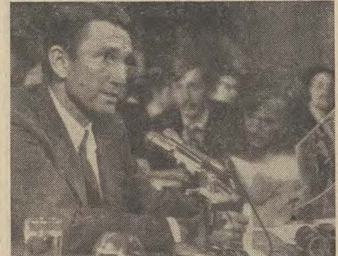
Były prokurator generalny USA Ramsey Clark udziela wyjaśnień członkom senackiej podkomisji d/s sądownictwa na temat swego pobytu w Wietnamie p.d. Obok mikrofonu, widoczne są fragmenty bomb, które Clark przywiózł z Hanoi.

wania Demokratycznej Republiki Wietnamu. W nocy z czwartku na piątek samoloty USA ponownie bombardowały północne przedmieścia Hanoi.