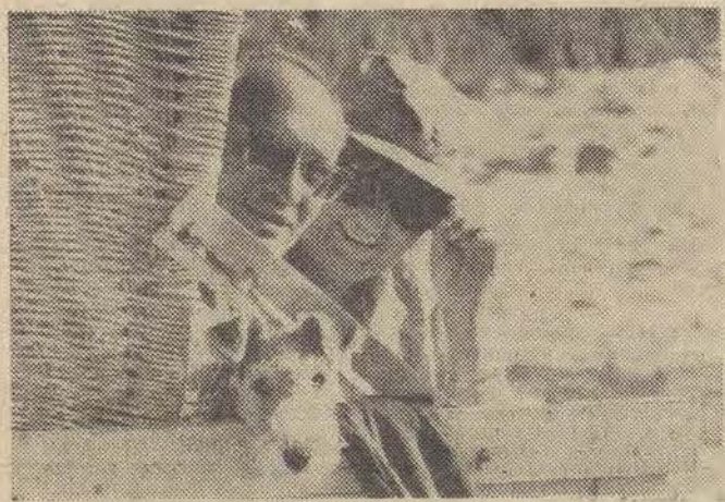
CAW — Sienko