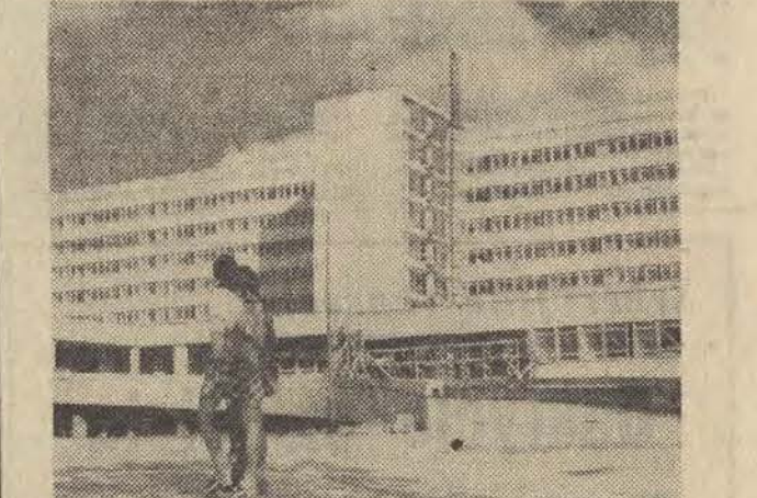
W Łodzi przy ul. Pabianickiej dobiega końca budowa wielkiego szpitala. Będzie on jednym z najnowocześniejszych w kraju obiektów służby zdrowia. Oto widok ogólny nowego łódzkiego szpitala.

W chwili obecnej nie został jeszcze ustalony ani termin wprowadzenia w życie tego zamierzenia, ani też konkretne decyzje co do systemu dyżurów. Należy się spodziewać, że zamierzenie to zrealizowane zostanie z pewnym opóźnieniem w stosunku do organizacji zakładów opieki zdrowotnej, aby nie stwarzać w tym i tak trudnym okresie dodatkowego zamieszania. W każdym bądź razie wydaje nam się, że przedsięwzięcie to ze wszelkim miar zasuguje na uwagę. (ter)