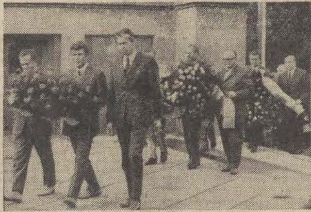
Na zdjęciu: moment składania wieńca przy Pomniku Bractwa Broni.