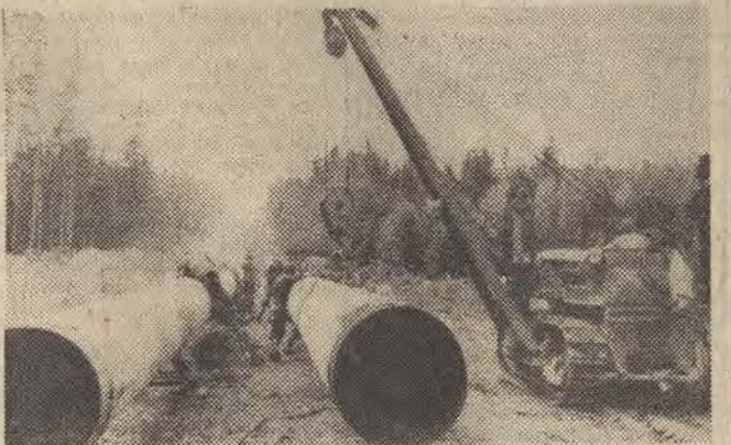
Północne odgałęzienie gazociągu tranzytowego biegnącego przez Czechosłowację, zbliża się do granicy NRD. Za najtrudniejszy uznano 300-metrowy odcinek nadgraniczny. N/z: ciężkie maszyny budowlane pomagają w pokonaniu trudnego terenu.