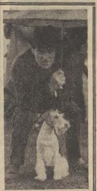
„Dukat” - foksterler szorstkowłosy, chroniony troskliwie przez swego pana przed śpiącym deszczem...