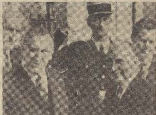
Powitanie E. Gierka przez prezydenta Pompidou

I sekretarz KC PZPR wraz z prezydentem Francji przechodzą przed frontem kompanii honorowej. Następnie Edward Gierek wita się z osobistościami francuskimi oraz z członkami ambasady PRL we Francji. Małżonka prezydenta Francji i małżonka I sekretarza KC PZPR otrzymują wiązanki kwiatów. Po chwili kawalkada samochodów w asyście eskorty motocyklistów mknie przystrojonymi (Dalszy ciąg na str. 2)