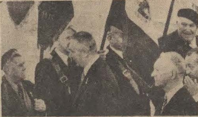
Na zdjęciu: Edward Gierek pozdrawia przybyłych na uroczystość kombatantów. Z prawej francuski premier Pierre Messmer.

◆ Zainteresowanie dalszym zacieśnieniem współpracy