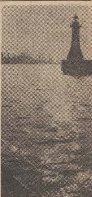
Latarnia morska przy wejściu do portu gdynieńskiego.

W czwartek w Moskwie zakończyło się trzydniowe międzynarodowe spotkanie przedstawicieli 70 krajów poświęcone 50-leciu proklamowania ZSRR. Uczestnicy spotkania przyjęli m. in. rezolucję, w której wzywają cały postępowy świat do działania na rzecz położenia kresu agresji USA w Indochinach, a także na rzecz trwałego i sprawiedliwego pokoju na Bliskim Wschodzie.