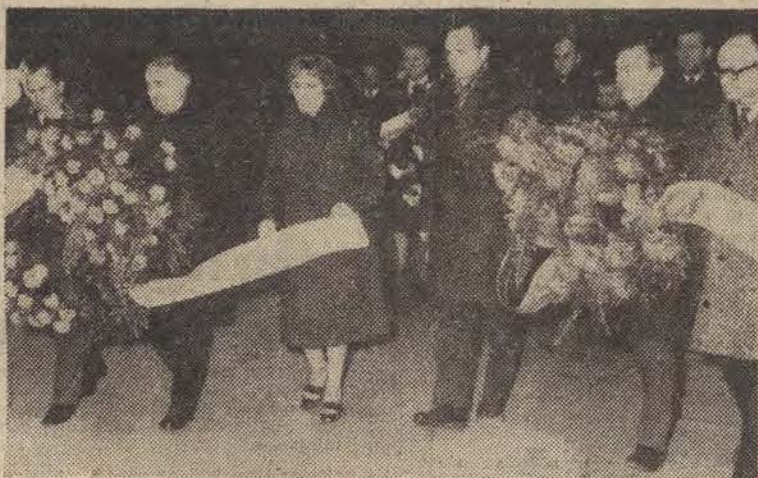
Delegacje władz partyjnych i administracyjnych Łodzi i województwa składają wieńce przed Pomnikiem Braterstwa Broni.

Majakowskiego, B. Okudźawy Scenariusz i reżyseria — J. Maciejowskiego. Całość składała (Dalszy ciąg na str. 2)