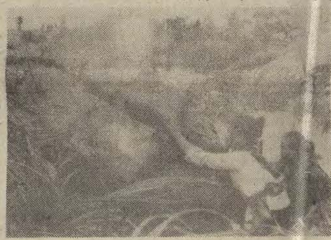
Na zdjęciu: obrona przeciwlotnicza DRW w wiosce w prowincji Quang Binh gotowa do odparcia wroga.