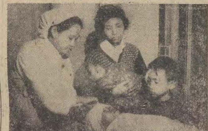
Troje dzieci północnowietnamskich, rannych podczas nalotu amerykańskiego, otrzymuje pierwszą pomoc w miejscowym szpitalu.

W poniedziałek rozpoczęła się w Paryżu kolejna, trzecia runda poufnych rozmów specjalnego doradcy delegacji DRW, Le Duc Tho, ze specjalnym doradcą prezydenta USA, Henry Kissingerem, od chwili uzgodnienia porozumienia w sprawie zawieszenia broni i przywrócenia pokoju w Wietnamie 20 października ub. roku.