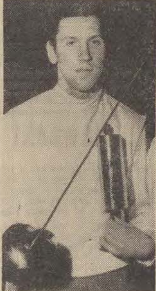
(Szczegóły na str. 2)