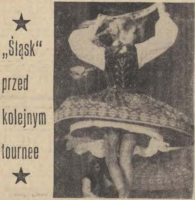
Zespół Pieśni i Tańca „Śląsk” wyjechał na miesięczne tournée do Francji. Występować będzie w Paryżu oraz miastach położonych w północnej części kraju. „Śląsk” wystąpi także w Belgii, w Brukseli i Liege.