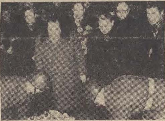
Wieńce składają delegacje KL i KW PZPR