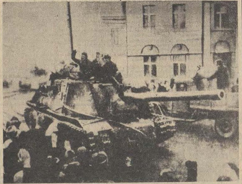
Pierwsze czołgi radzieckie wjeżdżają do wyzwolonej Łodzi — 19 stycznia 1945 r.

Delegat reżimu sąjgońskiego powtórzył tezę, że istnieje dwa niezależne państwa wietnam- skie i utrzymywał, iż jedynym reprezentantem ludności Wiet-