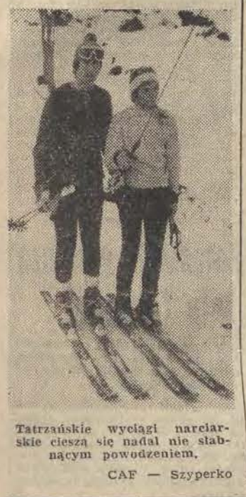
Tatzańskie wyciągi narciarskie cieszą się nadal nie słabnącym powodzeniem.