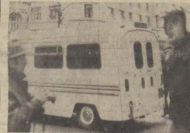
Do siedziby Indyjskiej Wysokiej Komisji w Londynie wdarło się 20 bm. 3 uzbrojonych osobników, którzy zabarykadowali się w budynku z personelem. Po przybyciu policji doszło do wymiany strzałów w czasie której dwóch napastników zostało zabitych, a trzeci aresztowany. Na zdjęciu: karetka pogotowia odwozi ciała zabitych z miejsca strzelaniny.