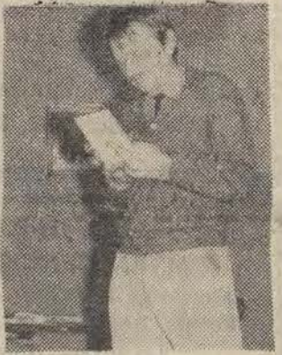
czytelnym, jasnym, pozbawionym zawilej retoryki. Jak to się zwykle określa, „mówi do rzeczy...”