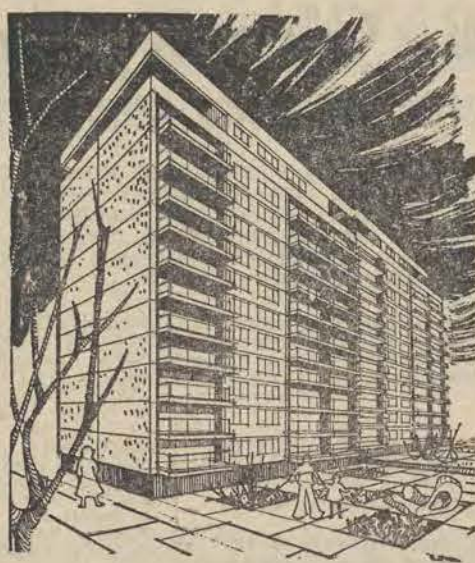
rys. arch. B. Romanowska

Jak już o tym naszym Czytelnikom donosiliśmy, załoga Łódzkiego Przedsiębiorstwa Budownictwa Miejskiego nr 3, wznosi fabrykę domów, na zakupionej w NRF licencji firmy „Kesting”. Już w lipcu planuje się początek montażu pierwszych domów mieszkalnych z elementów wyprodukowanych w tej nowej łódzkiej bazie prefabrykacyjnej. Staną one na osiedlu Łęczycka — Przędzalniana — Północ, którego gospodarzem zostaje RSM „Bawelna”.