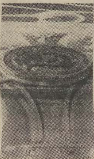
Widok ogólny na największe francuskie lotnisko, budowane obecnie w Roissy pod Paryżem. Ma ono rozciągnąć założone lotnisko Le Bourget.