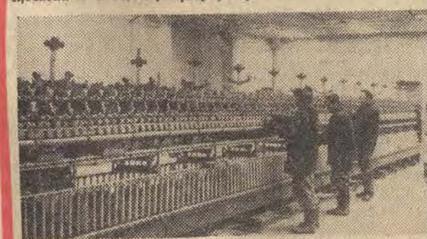
W Łodzi powstał nowy zakład — Przedziałnia Czesankowa Anilany „Polanil”. „Polanil” będzie produkował 4 tys. ton przędz anilanej rocznie. Na zdjęciu: montaż przędzarek.