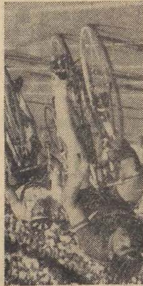
10. V. Stebny Kask, stadion nowy (indywidualnie i parami) przy ul. 22 Lipca.