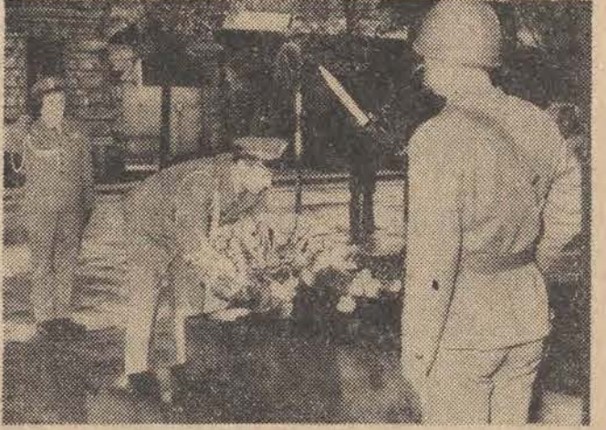
N.z.: wieńiec przed Grobem Nieznanego Żołnierza składa delegacja Łódzkiego Garnizonu WP.