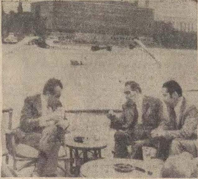
Na pokładzie prezydenckiego jachtu „Sequoia” na rzece Potomac Leonid Breżniew i prezydent USA Richard Nixon.

Sekretarz generalny KPZR Leonid Breżniew i prezydent USA Richard Nixon kontynuowali w środę przez cały dzień intensywne negocjacje w Camp David — rezydencji prezydenckiej Orah Mylandu około 100 km od Waszyngtonu.