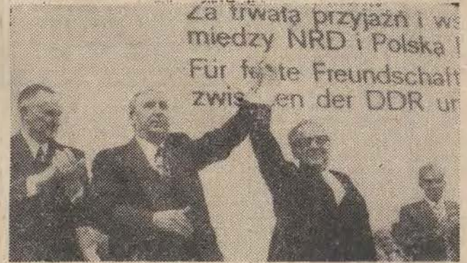
Na zdjęciu: E. Gierek i P. Jaroszewicz pozdrawiają zebranych na wiecu mieszkańców Berlina.