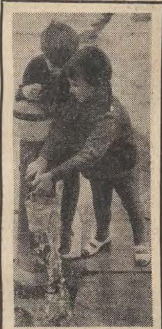
Dorosłym źródł uliczny kojarzy się najczęściej z uciążliwością codziennego życia i dźwiganiem wiader wody do domu. Dla dzieci — jest to czasem źródło radości...

W Łódzkich Zakładach Mięsnych spodziewany jest w tych dniach gość ze Stowarzyszenia Zjednoczonych, który przyjeżdża w charakterze eksperta w związku z kontaktami handlowymi z tym państwem. Ponieważ specjalista jest bardzo wysoki — jego wzrost wynosi 215 cm — Zakłady Mięsne specjalnie zleciły uzyćcie dla niego bialego fartucha w tym rozmiarze.