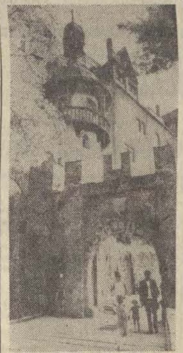
W zabytkowym zamku Rochsburg w NRD licznie odwiedzany przez turystów mieści się obecnie hotel.