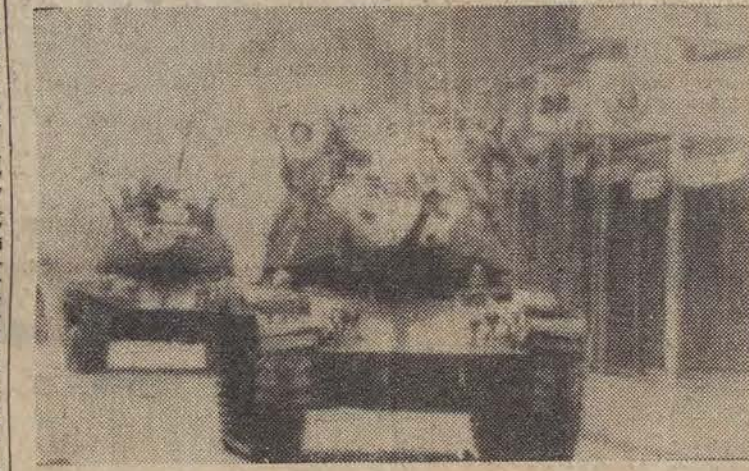
Na zdjęciu: czolgi na ulicach Santiago.