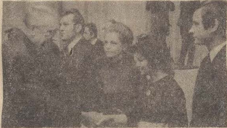
9 bm. w śmachu KC PZPR odbyło się spotkanie lektorów, wykładowców i seminarzystów