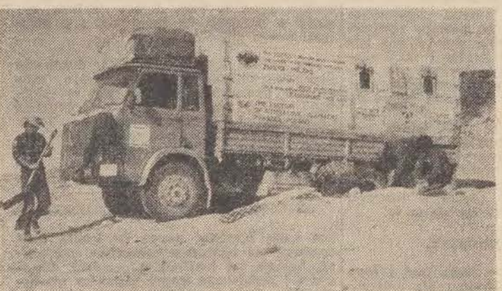
Kolejne zakopanie się „Baški” w saharijskich piachach.