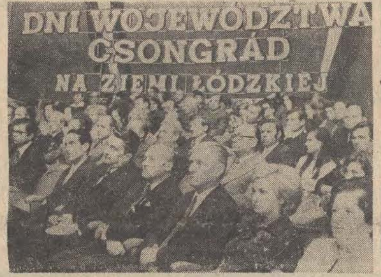
Z udziałem ambasadora WRL

Wczoraj, w ramach obchodów trzydziestolecia łódzkiego środowiska akademickiego, zainaugurowano trzydniowe Studenckie Święto Wiosny — „Juwenalia 75”.