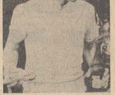
ma górską odbyła się bez udziału biało-czerwonych Lider wyścigu jeszcze raz potwierdził swoje wysokie (Dalszy ciąg na str. 2)

A mogłoby być jeszcze lepiej, gdyby koleżdy Szurkowskiego bardziej aktywnie pracowali na końcowych kilometrach. Nie można tu mieć większych pretensji do Brzeżnego (najlepszego „górala” wyścigu) i Mytlika. Ta dwójka dała z siebie wiele. Niestety, nie można tego powiedzieć o pozostałych trzech naszych reprezentantach którzy nie zdołali zabrać się z 32-osobową czołówką, tracąc kolejną sporą „porcję” czasu. Niepokoi szczególnie słaba faza ubiegłorocznego triumfatora WP — Szozdy Opolanin iako trzeci z Polaków znalazł się na liście najlepszych „górali”. Wczoraj był właśnie etap górzisty, ostatni w tym wyścigu. Ale Szozda nie wykazał się na trasie do Trzyńca jako doskonały zawodnik w pokonywaniu wzniesień.