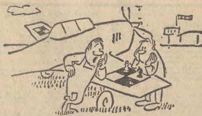
— Teraz twój ruch!...

MIŁOŚĆ PODOBNO NIE JEDNO MA IMIĘ, MOŻE BYĆ GORĄCA LUB OZIEBŁA, DOPIERO SIĘ ZACZYNA LUB JUŻ KOŃCZY, JEŚLI CHCESZ WIEDZIEĆ, JAKIE JEST TWOJE UCZUCIE DO PARTNERA, ODPOWIEDZ SZCZERZE NA PONIŻSZE PYTANIA I ZA KAŻDĄ ODPOWIEDZ „TAK” POLICZ SOBIE 1 PUNKT.