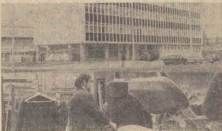
Tłum. BARBARA KALAMACKA