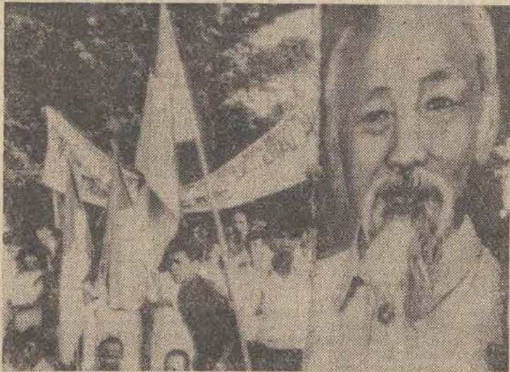
19 maja cały Wietnam obchodził 85 rocznicę urodzin wielkiego przywódcy rewolucji wietnamskiej zmarłego w 1969 r. prezydenta DRW — Ho Chi Minha. Na zdjęciu: uroczystość w Salgonie