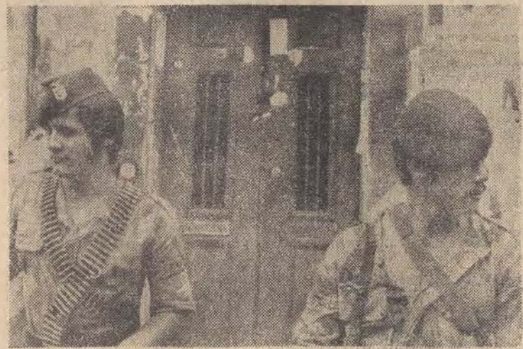
20 bm. wojsko portugalskie zajęło posterunki w wielu punktach Lizbony aby nie dopuścić do kolejnych prowokacji reakcji ultralewicowej. Na zdjęciu: posterunek wojskowy przed budynkiem w którym mieści się redakcja komunistycznego dziennika „Republica”.