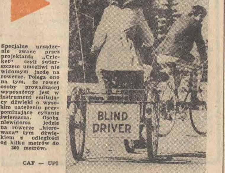
Specjalne urządzenie zwane przez projektanta „Cric-kec” czyli „świerzcem” umożliwi nie widomym jazdę na rowerze. Polega ono na tym, że rower osoby prowadzącej wyposażony jest w instrument emitujący dźwięki o wysokim natężeniu przypominające cykanie świerszcza. Osoba niewidoma jedzie na rowerze „kierowana” tym dźwiękiem z odległości od kilku metrów do 200 metrów.