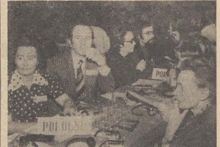
N/z: na sali obrad