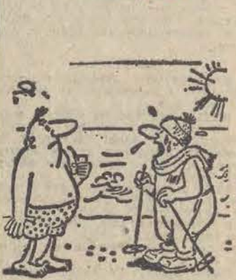
— A bo ja wykorzystuję sąsiadów... urlop zimowy!